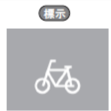
【普通自転車歩道通行可】