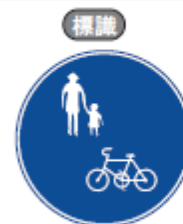
【自転車及び歩行者等専用】